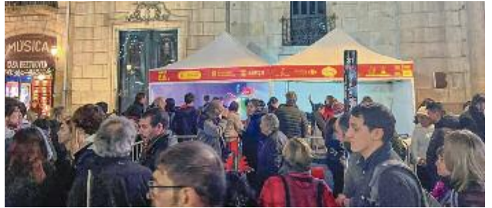
Quatre imatges que evidencien la popularitat de la Rambla durant les festes nadalenesques.