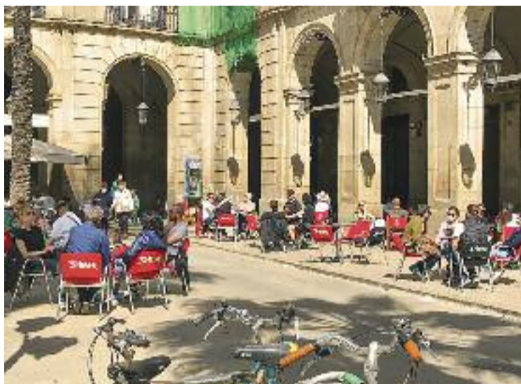
Una imatge d'un vermut a l'exterior de la mítica sala.