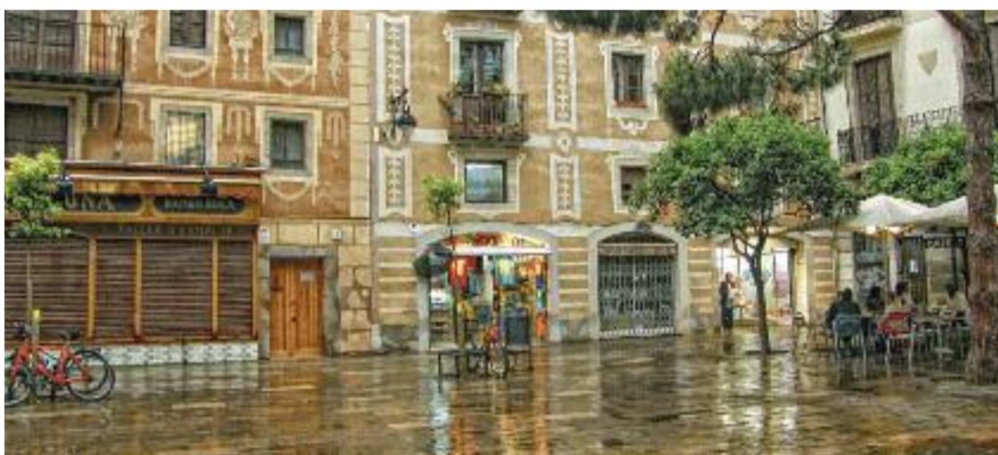
A l'esquerra, l'edifici del segle XIX que acull la històrica Associació Antic Gremi de Revenedors.

L'activitat del gremi es regulava mitjançant uns Capítols, que especificaven els drets i deures dels comerciants. Aquells documents regulaven qüestions laborals, assistencials i fins i tot comercials, com el control de preus. Si hi havia dubtes sobre com interpretar-los, els agrimiats elevaven una sol·licitud als prohoms perquè establissin unes Ordenacions. L'any 1613, per exemple, una d'aquestes ordenacions imposava per primera vegada un examen per poder regentar una botiga.