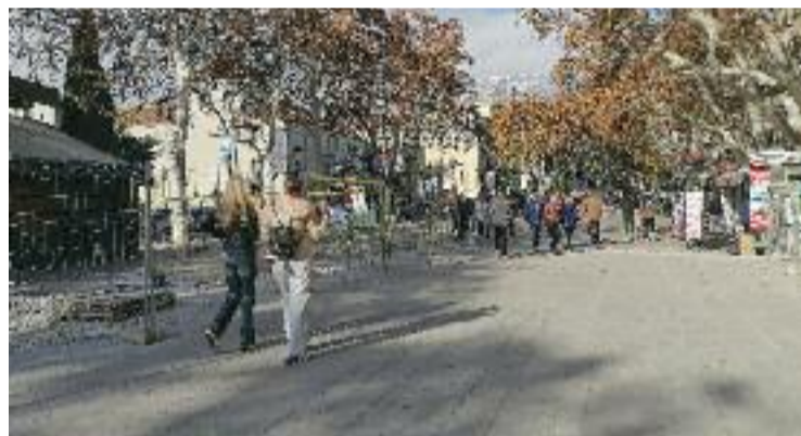
La part baixa ha recuperat part de la normalitat.

Posteriorment, es faran els altres quatre trams d'obres, previstos: Santa Madrona-Arc del Teatre, Arc del Teatre-Liceu, Liceu-Portaferrissa i Portaferrissa-Canaletes. Amb l'actualització del pla, es treballarà en les quatre zones de forma simultània i el termini global de la remodelació quedarà reduït a trenta-dos mesos, és a dir, una mica menys de tres anys.