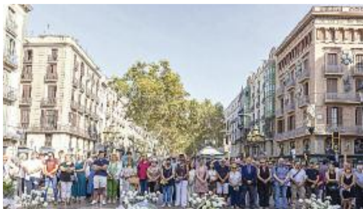
Homenatge als morts, el passat mes d'agost.

La sala del Suprem ha estimat en part el recurs de Ben Iazza perquè