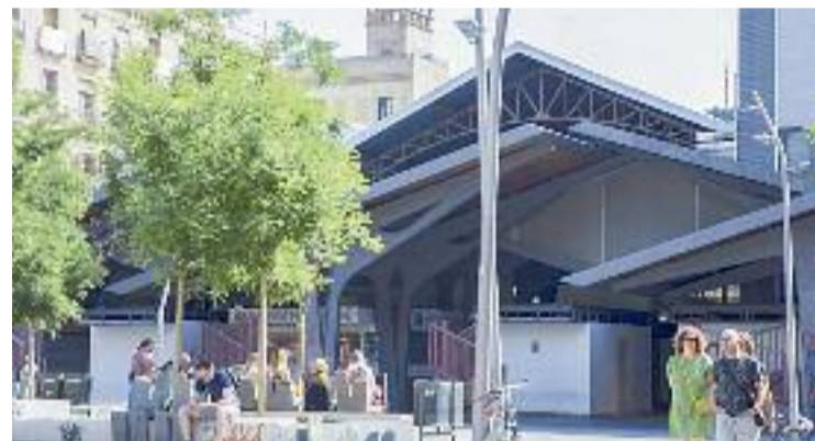
Els comerciants volen revitalitzar la plaça Gardunya.

L'Ajuntament s'ha mostrat obert a parlar amb els comerciants i discutir un nou pla de futur, un pla diferent del que hi havia fins ara sobre la taula i que preveia esponjar el mercat i reduir el nombre de parades, com s'ha fet en altres recintes.