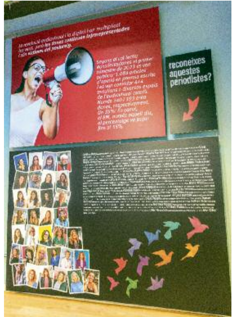
La mostra s'inaugurarà oficialment al llarg d'aquest hivern, però ja es pot visitar gratuïtament.