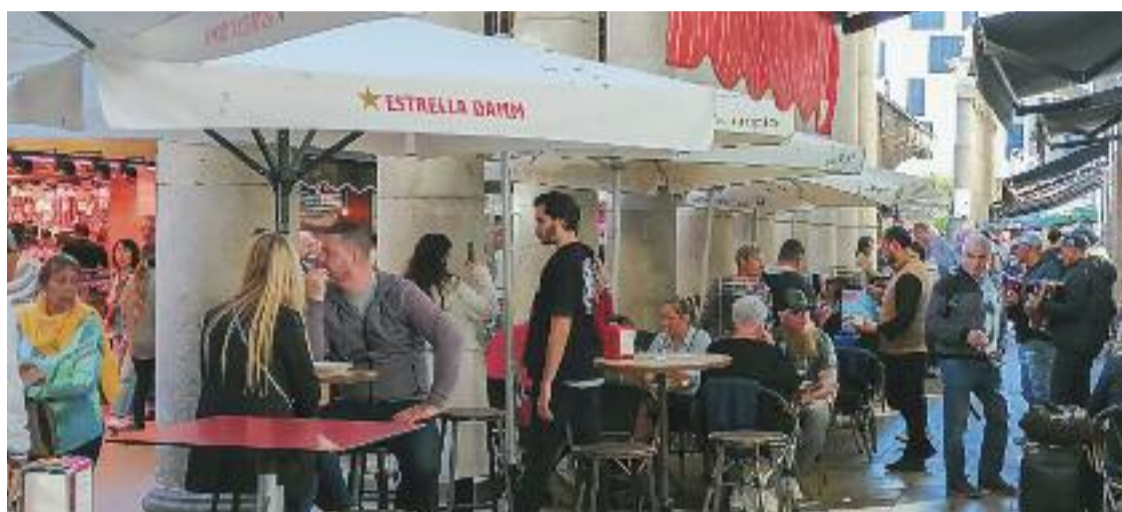
El Mercat de la Boqueria es manté al Top 10 dels punts més interessants.

Per temàtica, els allotjaments i els restaurants, al conjunt de la ciutat, assoleixen una puntuació molt similar (8,25 i 8,27, respectivament), mentre que els atractius, un 58% dels quals són culturals, destaquen per una valoració propera al 9. De fet, 7 de cada 10 opinions a les plataformes analitzades qualifiquen d'excel·lents els recursos d'aquesta categoria. Respecte a l'últim informe, totes les categories milloren lleugerament, però la restauració ho fa per una centèsima. En general, els turistes valoren positivament la ubicació dels allotjaments i fins i tot la qua-