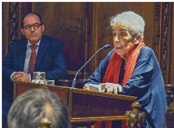
Colita va rebre el Ramblista d'Honor el 2018.

La consellera de Cultura, Natàlia Garriga, va lamentar la mort "d'una de les grans fotògrafes del nostre país" i va sentenciar que "la cultura catalana