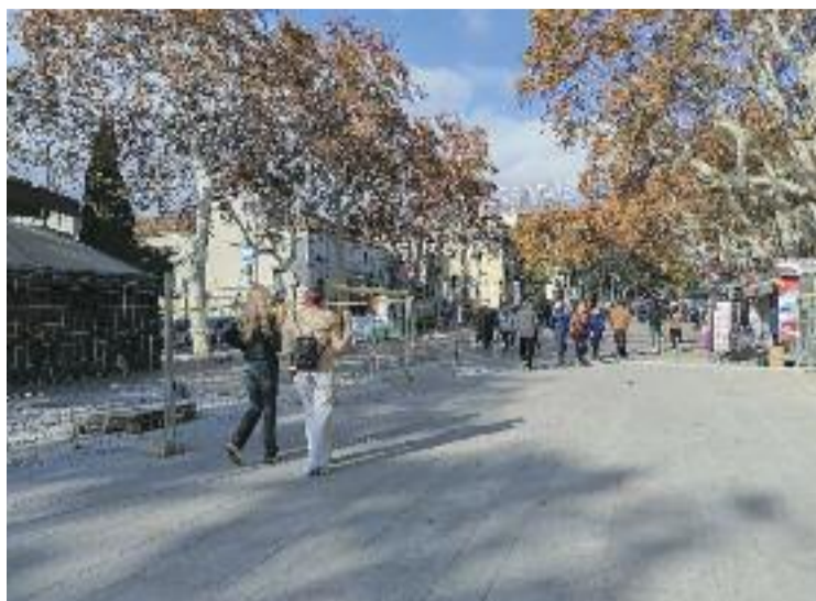
Una imatge del nou paviment instal·lat al passeig.