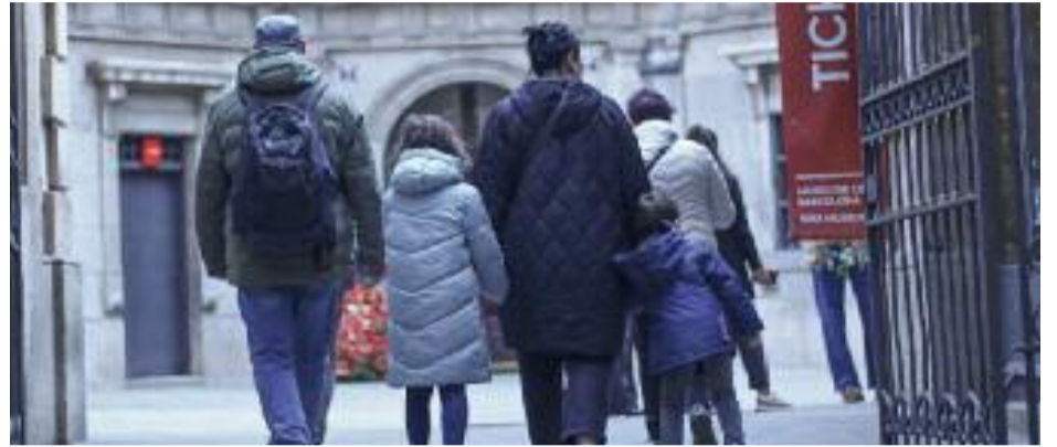
Imatges del Tast a la Rambla, un taller floral a la Boqueria, un concert nadalenc i el Rambling.